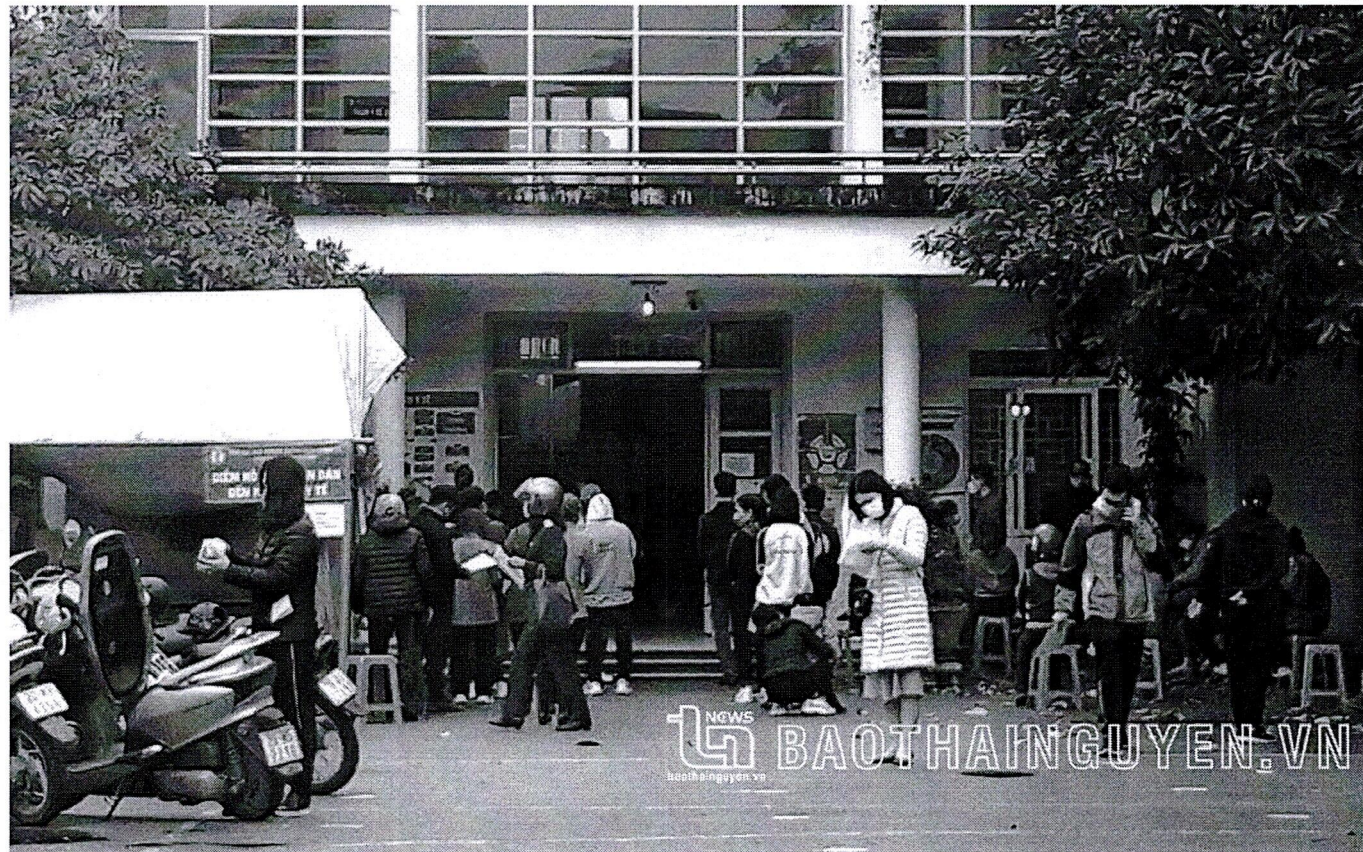
Quang cảnh tại Trạm Y tế phường Quang Trung (T.P Thái Nguyên).

Thấy trong người có triệu chứng nhiễm virus corona, tôi test và khi thấy hai vạch thì báo ngay cho người có trách nhiệm của tổ dân phố biết. Theo hướng dẫn, tôi ra Trạm Y tế phường Gia Sàng (thành phố Thái Nguyên) khai báo.