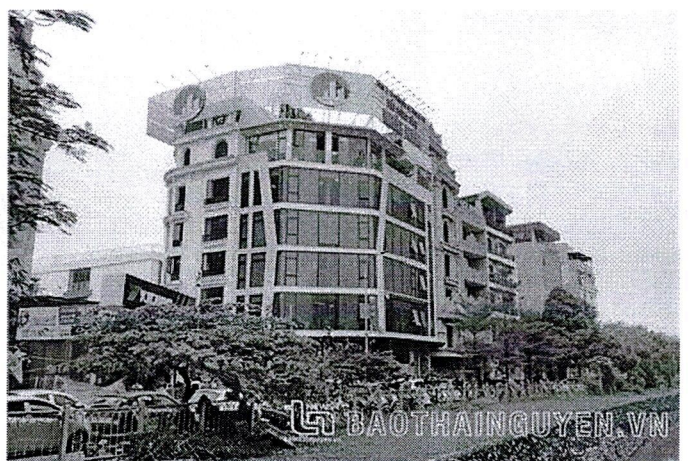
Dư luận đặc biệt quan tâm đến bài viết về Công ty...