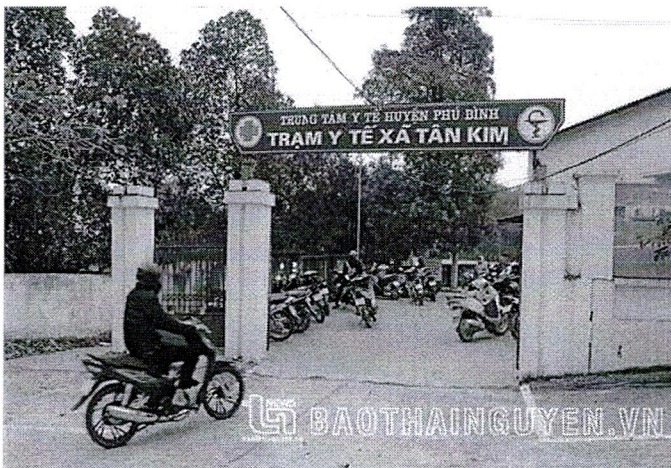
Bán thực phẩm chức năng cho người mắc COVID-19...