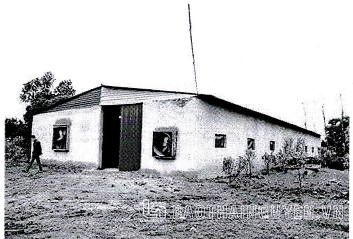
"Vấn đề" trong quản lý đất đai tại Minh Đức: Nhìn...!"